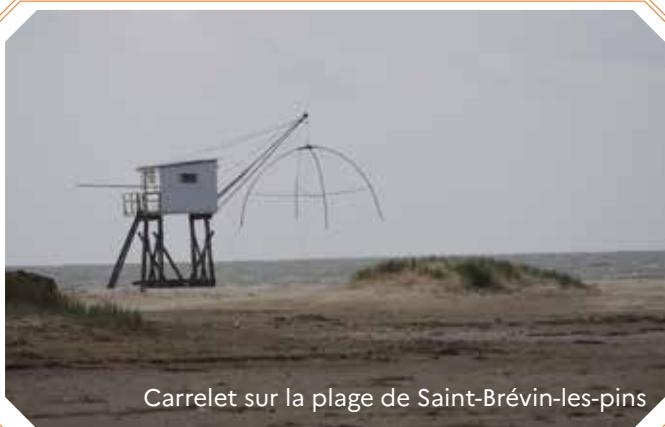
Carrelet sur la plage de Saint-Brévin-les-pins

Une dizaine d'entreprises maritimes détiennent le label Entreprise du patrimoine vivant (chantiers navals, conserveries).