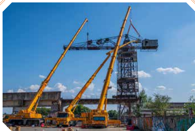
Démontage de la flèche de la grue noire de Nantes, construction métallique de 110 tonnes.

Le patrimoine industriel est aussi très présent. Il est lié à l'industrie de la conserve de poissons (l'interrégion a accueilli jusqu'à 250 conserveries) ou à l'activité portuaire. Parmi les trois grues protégées au titre des monuments historiques et qui témoignent du passé industriel maritime de Nantes, la grue noire, mise en service en 1942 et restée en activité jusqu'à la fin des années 1960, fait l'objet d'un chantier de restauration.