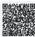
Offres de formation Maritime