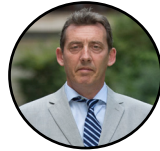
Fabrice Rigoulet-Roze Préfet de la région Pays de la Loire