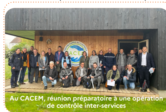
Au CACEM, réunion préparatoire à une opération de contrôle inter-services

La DIRM a réuni les inspecteurs de l'environnement de 24 unités de contrôle (DDTM-DML, gendarmerie, douanes, Office français de la biodiversité, réserves naturelles et