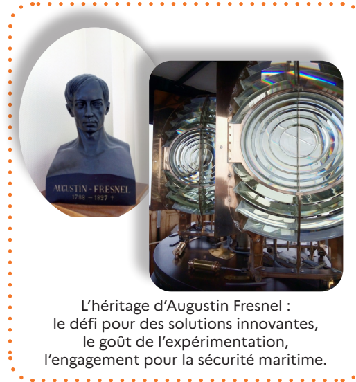
L'héritage d'Augustin Fresnel : le défi pour des solutions innovantes, le goût de l'expérimentation, l'engagement pour la sécurité maritime.

2 706 aides à la navigation dont 54 phares 116 conventions de mise à disposition de sites à des partenaires