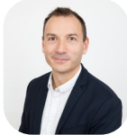
Nicolas Auger Infrastructures et équipements de sécurité maritime

Les optiques tournantes posent la question du mercure, enjeu de santé et d'environnement. La DIRM poursuit la mise en place de solutions alternatives, (roulement à bille sous bain d'huile ou sources lumineuses à Leds interchangeable), avec le soutien du Cerema.