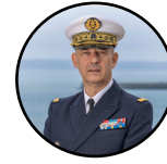
Jean-François Quérat Préfet maritime

La DIRM NAMO : 26 implantations 23 communes 6 départements 2 régions