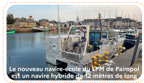
Le nouveau navire-école du LPM de Paimpol est un navire hybride de 12 mètres de long

Pour chaque navire, elle accompagne bureaux d'études, chantiers navals et armements dans la recherche de solutions alternatives, non prévues par les textes existants, mais présentant un niveau de sécurité équivalent.