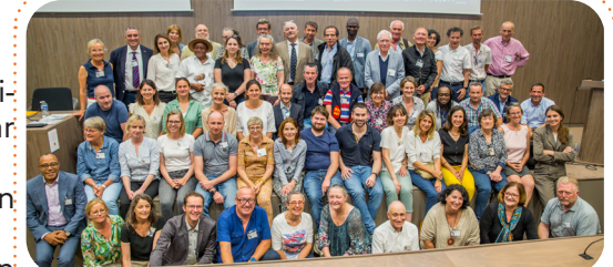
Les 20 e journées nationales de la médecine des gens de mer à Brest ont réuni 150 personnes

Former les acteurs sur cette problématique est indispensable. Aussi, un programme de formation des médecins de gens de mer de la DIRM est prévu dès 2024.