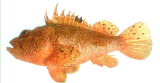
La Rascasse rouge